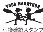
引換確認スタンプ