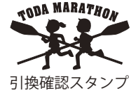
引換確認スタンプ